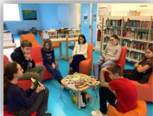
Atelier « Thé-lecture » décembre 2023

Ils sont le lien entre les élèves et les référents de l'établissement pour réaliser des actions concrètes durant l'année. D'ailleurs, le collège est labélisé E3D - Établissement en Démarche globale de Développement Durable.