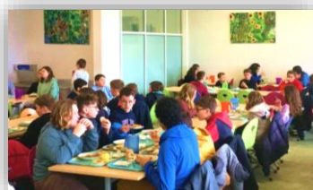
Pause méridienne au réfectoire

Les manuels scolaires sont prêtés gratuitement à chaque enfant par le collège. Seules les fournitures scolaires restent à charge de la famille.