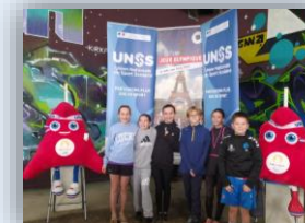
Championnat départemental de cross – décembre 2023