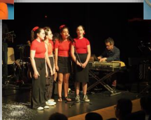
Spectacle de la chorale juin 2023