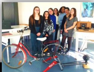
Atelier scientifique décembre 2023